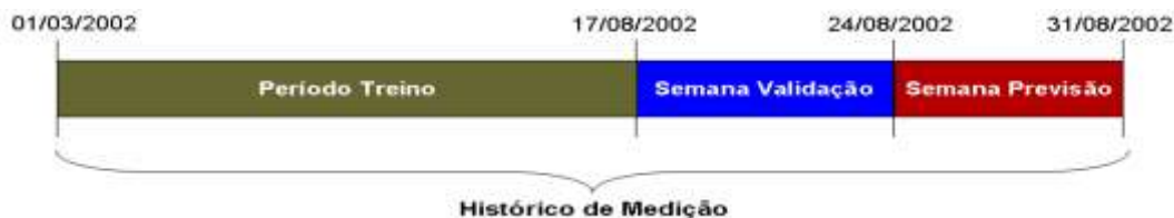
Figura 1 – Exemplo de um esquema de divisão do histórico de consumo de carga.

cada dia da semana considerada. A base de dados utilizada foi dividida em três partes (conforme visto na Figura 1) sendo que a primeira parte ficou reservada para treinamento, a segunda para validação e a terceira para teste. A princípio, a execução deste processo de previsão se deu utilizando apenas componentes de previsão, tratadas individualmente.